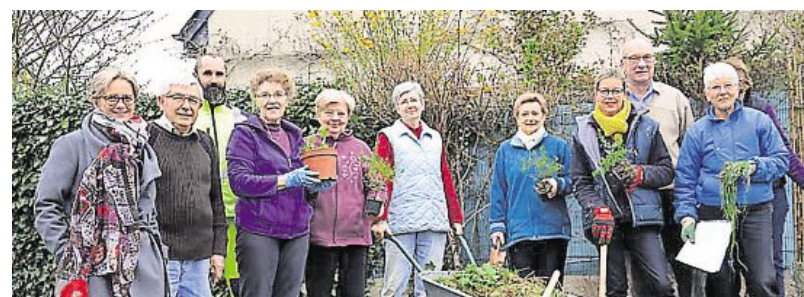
Jeudi, les jardiniers ont débuté la première phase d'entretien de leur espace vert.

L'été dernier, des habitants de la rue des Francs-Archers avaient manifesté, auprès de la mairie, leur envie de contribuer à l'embellissement de leur quartier, via le fleurissement d'un espace vert situé dans leur rue.